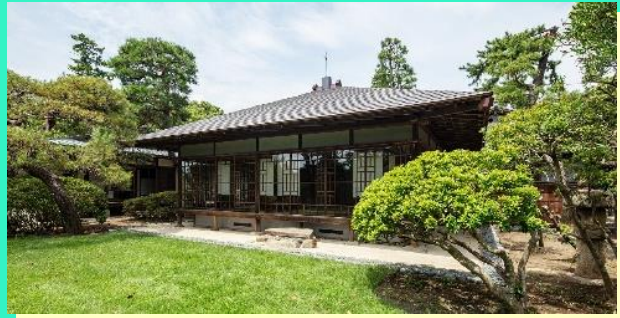
【旧大隈重信別邸・旧古河別邸】