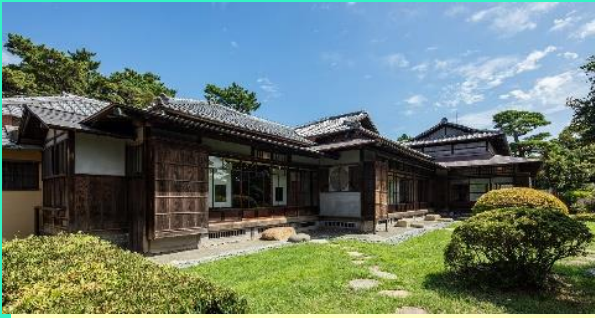
【陸奥宗光別邸跡・旧古河別邸】

歴代の総理大臣、明治期の政界人の邸宅や別邸跡が残る 明治記念大磯邸園などを巡ります。